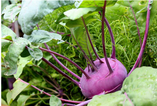
Paarse koolrabi - klaar om te oogsten

Het is belangrijk om te weten dat niet alle variëteiten het goed doen met een start in augustus. Paarse koolrabi houdt daar meer van dan groene variëteiten.