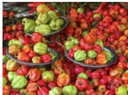
Pepers / piments