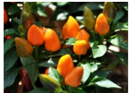
Sierpepers zijn lekker