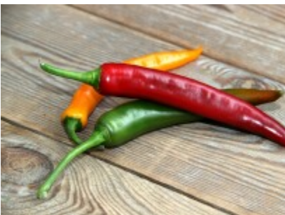
Paprika en pepers