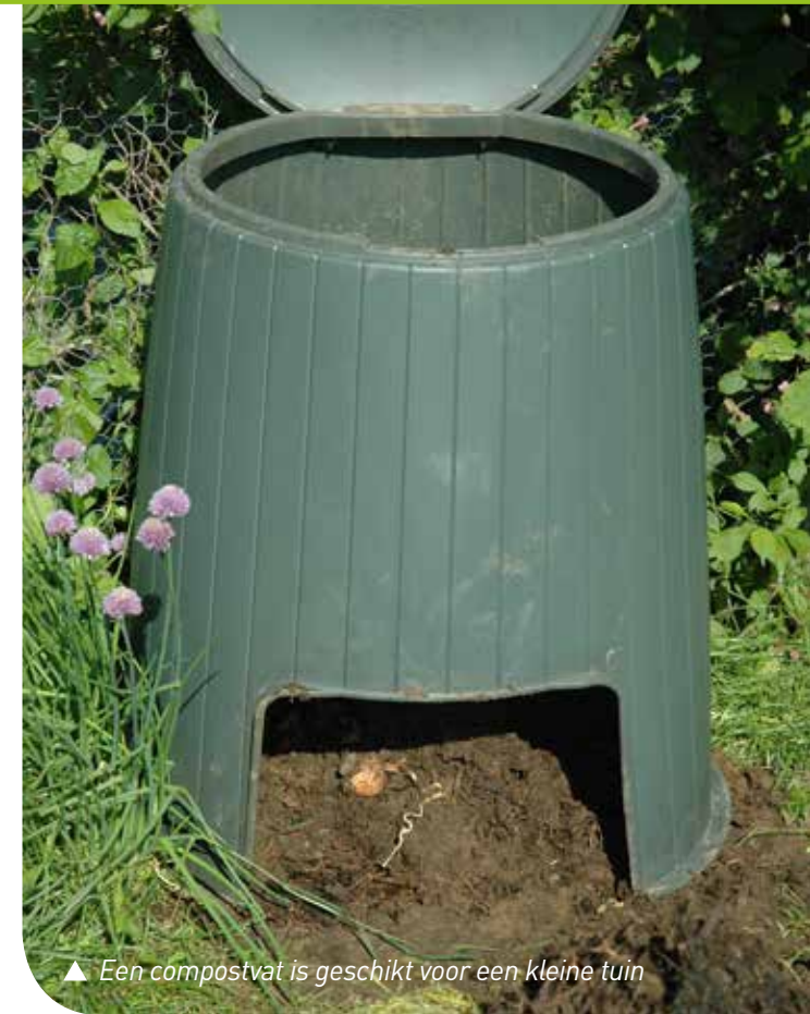
▲ Een compostvat is geschikt voor een kleine tuin

Een ton of vat is vooral geschikt voor een wat kleinere tuin. Voordeel is dat er geen vliegen bij kunnen komen en er geen geurtjes uit ontsnappen. Belangrijk is dat er drainage mogelijk is, dus let erop dat er een open bodem of een bodem met gaten en een afvoer is voor het teveel aan vocht. Je moet ervoor zorgen dat de inhoud van de ton of het vat direct contact heeft met de aarde. De aarde moet de bacteriën en schimmels leveren. Wel is het aan te raden eerst een laagje takken of ander grof materiaal neer te leggen op de plaats waar je de ton neer gaat zetten, zodat er ventilatie is. Als je de compost in de ton regelmatig omzet, zal het proces versneld worden.