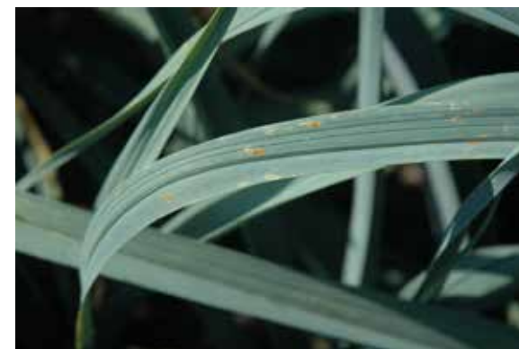
▲ Roestschimmels kun je gemakkelijk opmerken door de roestbruine puistjes op de bladeren

Een gezonde moestuin, zowel voor jezelf als voor het intense plantaardige en dierlijke leven dat in je tuin voorkomt: daarnaar moet je streven. Daar hebben we een goede bondgenoot voor: de natuur met al zijn biodiversiteit! Met de volgende tips kom je alvast een heel eind weg.