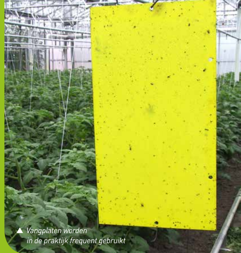
▲ Vangplaten worden in de praktijk frequent gebruikt

Voor de hobbytuinder staat het wegvangen van schadelijke insecten nog in zijn kinderschoenen,