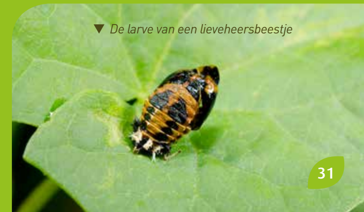
▼ De larve van een lieveheersbeestje

Doe regelmatig waarnemingen. Weet jij hoe een larve van een lieveheersbeestje eruit ziet? Verwar ze niet met de larve van de coloradokever, want ze eet tot 100 bladluizen per dag. Is ze onbekend voor je? Dan zou je wel eens de fout kunnen maken ze te doden. Al een bladluismummie gezien? Het is nochtans noodzakelijk dat je die kent, want dit zijn bladluizen geparasiteerd door een sluipwesp. De larve van de zweefvlieg en de galmug leeft midden zijn prooi, de bladluizen. Die moet je echt wel kennen, net zoals de iets donkerder kleur van geparasiteerde vlindereitjes (door de sluipwesp). Zo kom je stilaan te weten, dat er wel degelijk