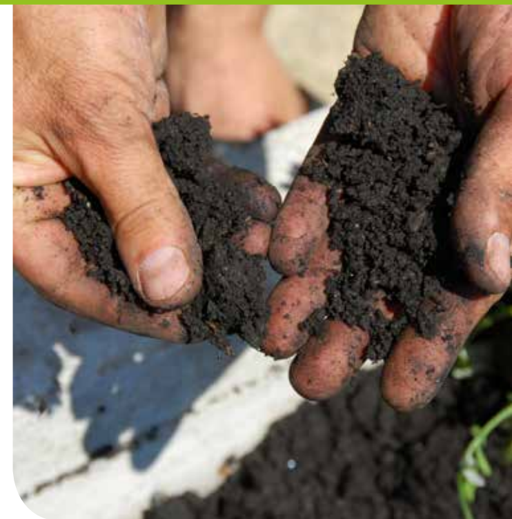
Hoe je het humusgehalte in de grond ▲ kunt verhogen lees je op pagina 12

Een grond met alleen maar zand-, leem- of kleikorrels, of een mengsel daarvan is op zich nooit goede teelaarde. De structuur van zulke grond is slecht. Denk maar aan de zandgrond uit de duinen die tussen je vingers wegloopt. Of de klei die gebruikt wordt om te boetseren of te bakken, daar kun je ook niet op telen. Het is de hoeveelheid humus die ervoor zorgt dat deze grondsoorten bruikbaar zijn om groenten op te telen. Humus, dat ontstaat door vertering van organisch materiaal, zal de grondkorrels samenhouden waardoor er een kruimelstructuur ontstaat. Een goede kruimelstructuur maakt een eenvoudige grondsoort met losse korrels tot goede teelaarde.