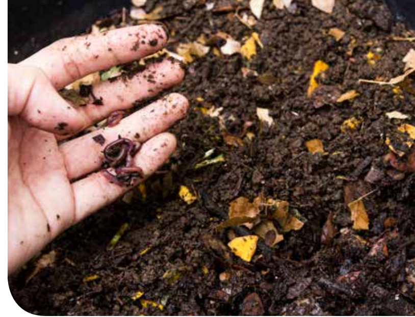
▲ Bodemleven gebruikt het organisch materiaal als voedingsbron

Talrijke diertjes, regenwormen, en micro-organismen (schimmels en bacteriën), zullen het organisch materiaal gebruiken als voedingsbron. Zij zorgen zo voor de vertering en omzetting tot minerale voeding voor de planten én tot humus. Veel van die micro-organismen hebben ook een