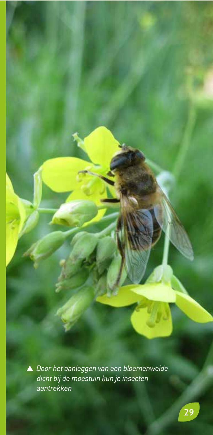
▲ Door het aanleggen van een bloemenweide dicht bij de moestuin kun je insecten aantrekken

Veel voorkomende insectenplagen zoals wortelvlieg, preivlieg, koolvlieg en rupsen van vlinders kunnen we verhinderen door een tunnel te maken afgedekt met insectengaas. De laatste jaren maakte deze techniek enorme opgang, waardoor je in ieder tuincentrum het juiste gaas zult vinden. Breng het insectengaas aan onmiddellijk na het planten en laat het liggen tot de oogst of hoogstens enkele dagen daarvoor.