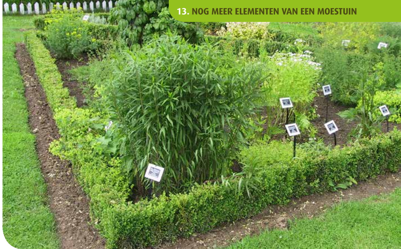
▲ Een kruidentuin hoort erbij voor wie ten volle wil genieten van zelfgekweekte groenten in de keuken

Als je in de keuken ten volle wil genieten van de zelfgekweekte groenten, horen daar zeker en vast ook kruiden bij. Heel veel plaats moet je voor kruiden niet voorzien. Van de meeste kruiden volstaan één of enkele planten. Het hangt natuurlijk af van wat je graag gebruikt in de keuken. Wie